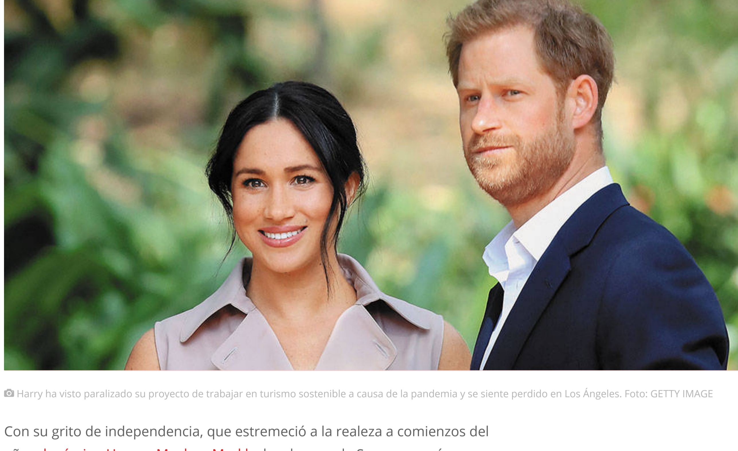
Harry ha visto paralizado su proyecto de trabajar en turismo sostenible a causa de la pandemia y se siente perdido en Los Ángeles.

El hijo menor de Lady Di ha visto frustrado su deseo de iniciar una nueva vida en Estados Unidos y eso lo ha puesto a pensar si renunciar a la familia real británica fue la mejor decisión, asegura la prensa de Londres. Este artículo forma parte de la revista "Jet-Set".