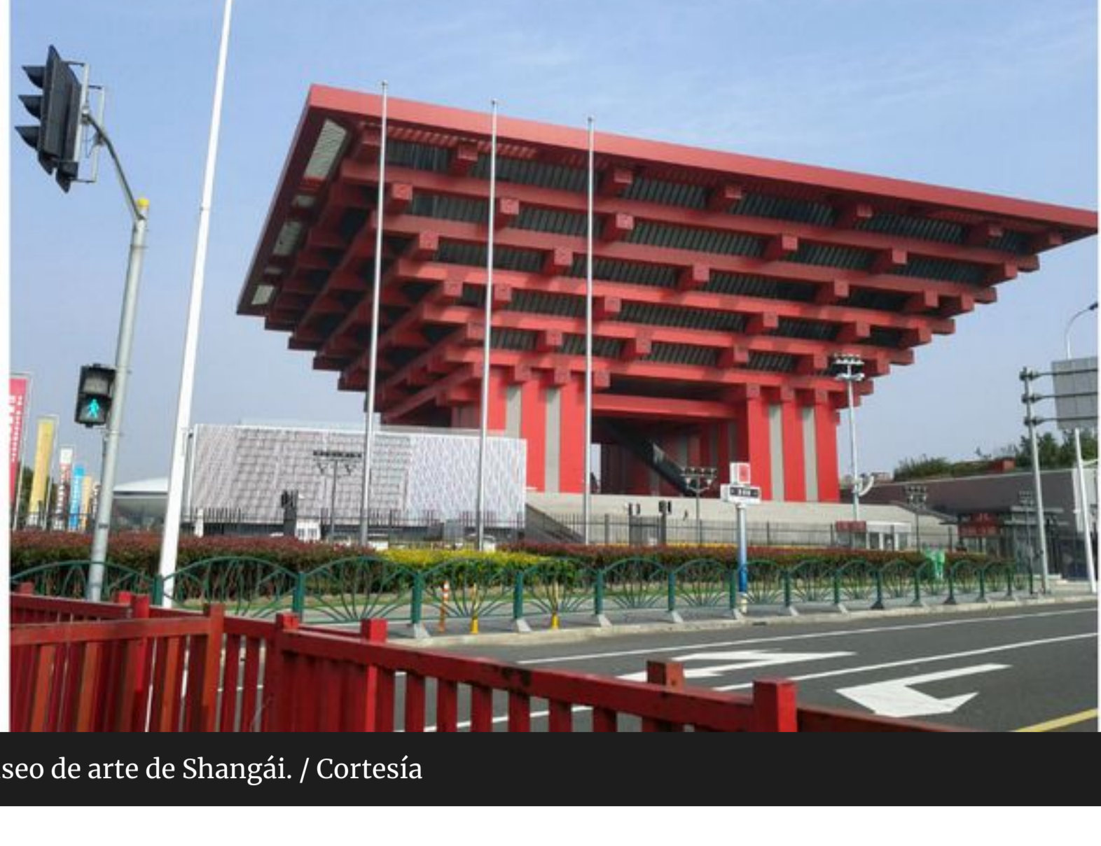
Museo de arte de Shanghái.

"Hay un número importante de artistas de origen latino y tres españoles que están en lugares prominentes de la exposición", apuntó en una entrevista el doctor en Historia y Teoría del Arte, creador de esta muestra, uno de los eventos artísticos más relevantes de arte contemporáneo en China.